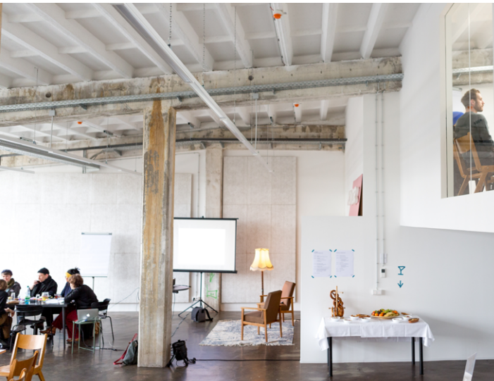
Impressionen aus dem Lab 2023 in Erfurt