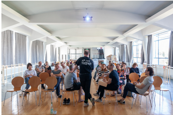
Camp #1 Februar 2025