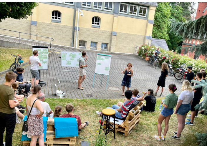
◀ Der Verein FACK e.V. aus Altenburg war mit dem Projekt FACKtory beim Jahrgang 2023 dabei.

Ziel der Stadtmachen Akademie ist es, solche Entwicklungspartnerschaften zu stärken und damit gute Impulse für nachhaltige gemeinwohlorientierte Entwicklungen vor Ort zu setzen.