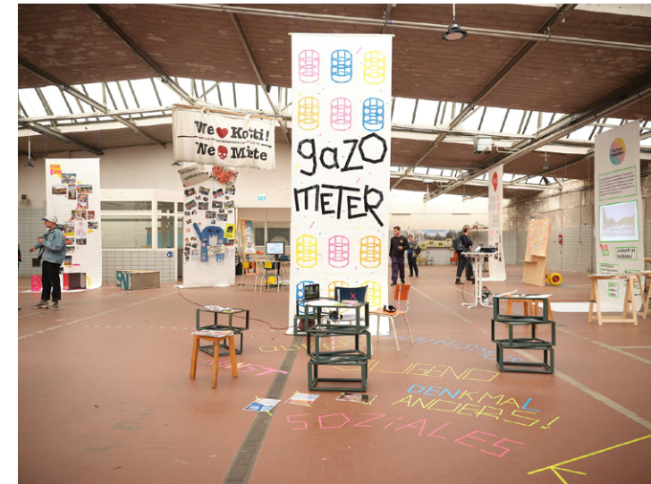
Impressionen aus dem Symposium 2023 in Berlin